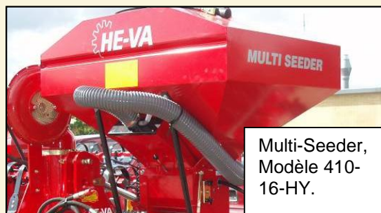
Multi-Seeder, Modèle 410- 16-HY.