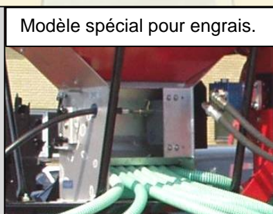
Modèle spécial pour engrais.