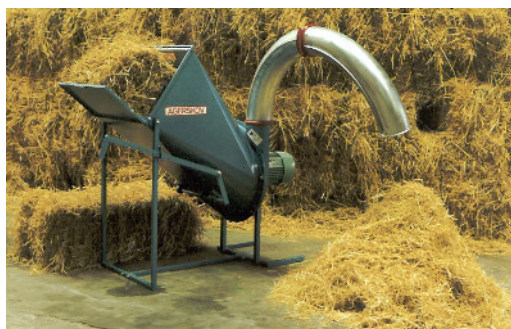
SV – fixe avec moteur électrique 10 CV projection verticale standard – Tuyaux ø160mm. projection au sol en option no. 350063-350067