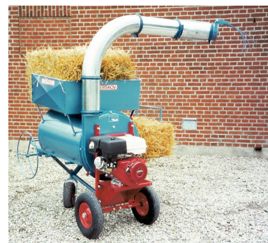
AM 35 AL ou AV AL – projection au sol AV – projection verticale Alimentation par chaîne de fond.

Les pailleuses Strø-Combi sont construites pour le broyage de paille en balles ou en vrac dans des longueurs de 2 à 8 cm. (Longueur de hachage variable)