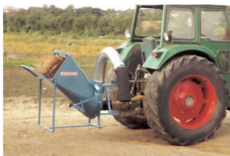
TV - projection vertical - TL avec projection au sol pour tracteur no. 350042-350045. TDU avec plateforme pour distribution de paille entre deux plates-bande de fraiseurs à la fois - Item no. 350052