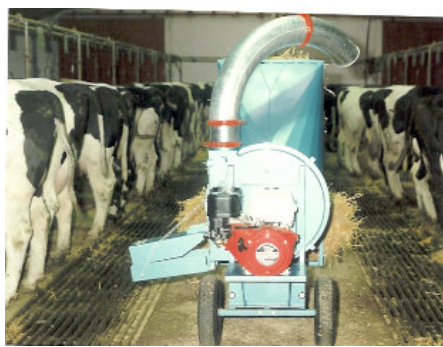
AM 35-BLV Universel, projection verticale et au sol pour étables, porcheries, logettes, etc. no. 350034- 350035-350036-350037