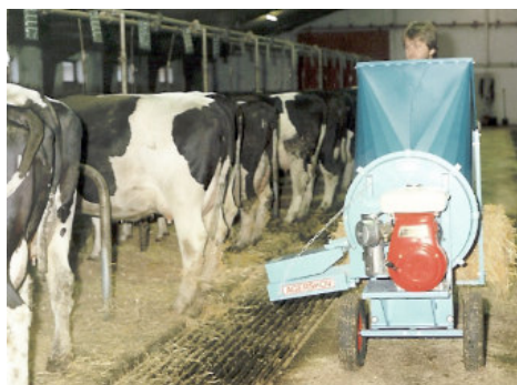
AM 35-BL projection au sol pour étables, logettes, etc.. no.350022- 350023-350026-350026

Pour hacher la paille et pallier en une seule opération