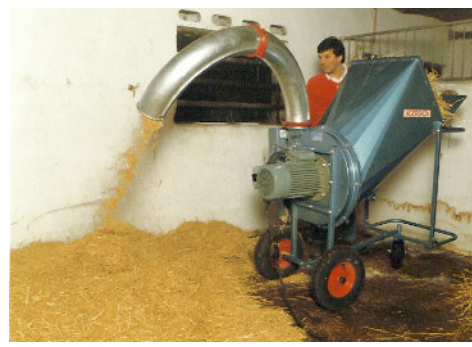
AM 35 BV – projection verticale pour porcheries, logettes, etc. ø160mm tuyaux – pivotons de 360° no. 350028-350029-350031-350032